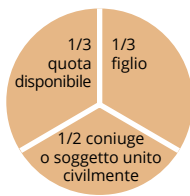
Solo coniuge o soggetto unito civilmente e un solo figlio