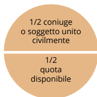
Solo coniuge o soggetto unito civilmente

Qualora il testatore non abbia legittimari può nominare erede universale un ente senza ledere alcun soggetto.