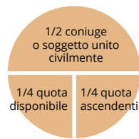
Solo coniuge o soggetto unito civilmente e ascendenti