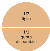
Solo un figlio