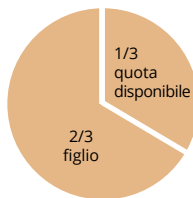
Due o più figli