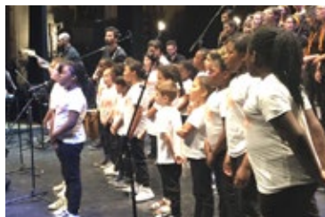
Nasce il coro di Oliver .