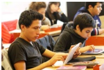
Viene inaugurata la Scuola Oliver Twist .