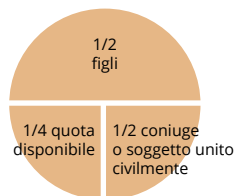
Solo coniuge o soggetto unito civilmente e più figli